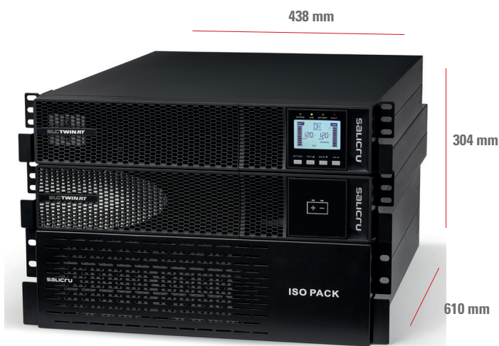
KIT SLC 6000/10000 TWIN RT2 T UL